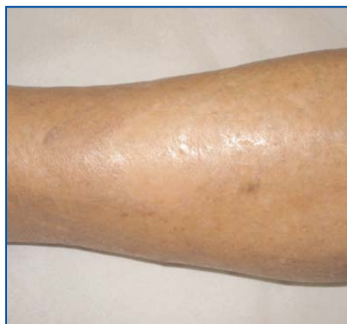
La situazione pre e post innesto

Ad ottobre sarà distribuita la nuova scheda dell'Enciclopedia della Salute, dedicata ancora alla Chirurgia Plastica Ricostruttiva