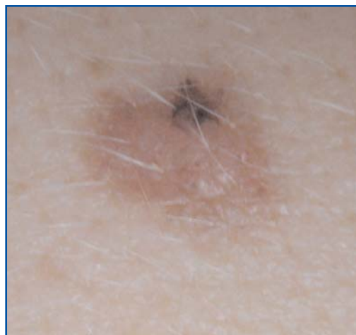
Un tumore della pelle

La Chirurgia Estetica, migliorando l'estetica della persona, porta un giovamento anche a livello psicologico, aiutando il paziente a riacquistare maggiore autostima e sicurezza, sia verso se stesso che nei confronti degli altri.